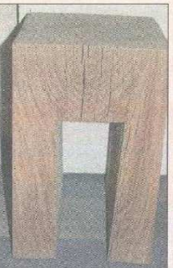
Bis zu 150 Jahre alt ist das Eichenholz der Nachttischchen.