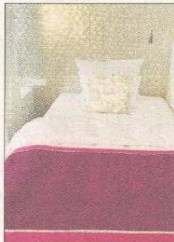
Dieses Zimmer ist „fäulich“ eingerichtet.

Nicht nur Hotelgäste können dort Ayurveda Massagen, Klangliege, Salzaudio und Floating Tank benutzen.