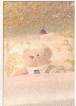
Auf Details wird wert gelegt.