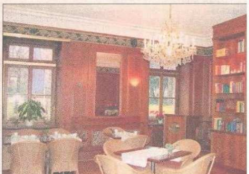
Frühstückstisch mit Blick auf den Colombipark.