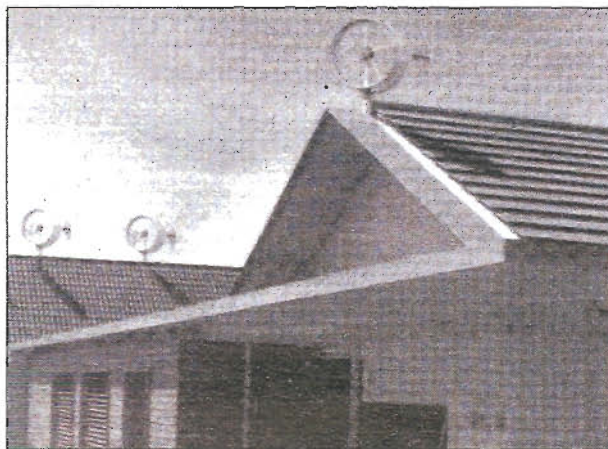
Formschönes Design für jedes Dach.

auch für den Einsatz in bebauten Gebieten geeignet ist. Die Windturbine hat eine Nennleistung von 500 Watt. Der hochpolige, permanent erregte Synchron-generator, beginnt bereits bei einer Windstärke von 2,5 Meter/Sekunde mit der Stromerzeugung.